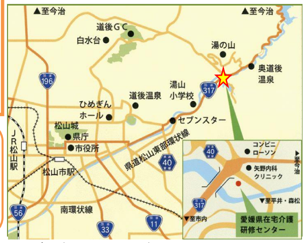
【当センターの周辺図】

“ みんなで学ぼう介護のいろは ” <お問い合わせ先> 愛媛県在宅介護研修センター （愛称： 愛ケア ） TEL：089-914-0721 FAX：089-914-0732 （ホームページ） https://ehime-zaitakukaigo.com/