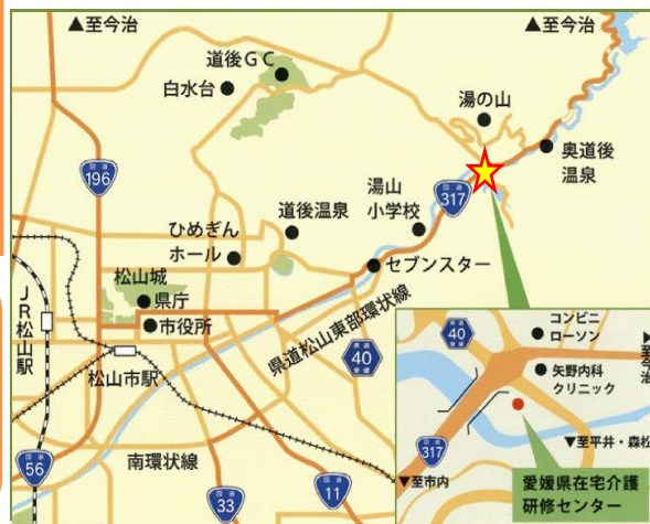
【当センターの周辺図】