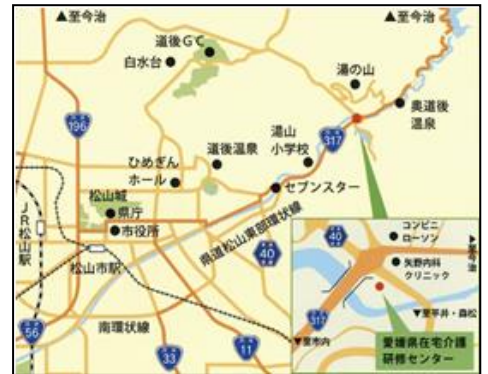
【当センターの周辺図】